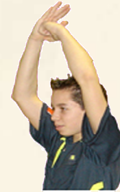
Passage en force Percussion