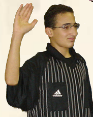
Avertissement de jeu passif