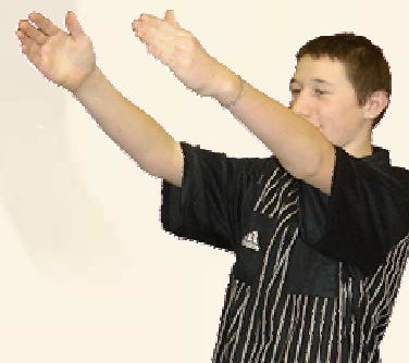
Remise en jeu