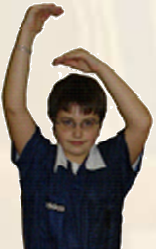
Marcher ou 3 secondes