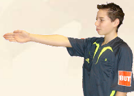
Jet Franc (direction)