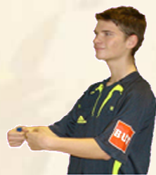
Ceinturer Retenir Pousser