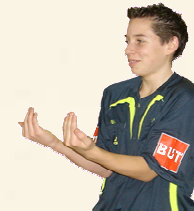
Autorisation de pénétrer sur le terrain