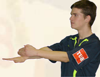
Faute sur le bras Frapper