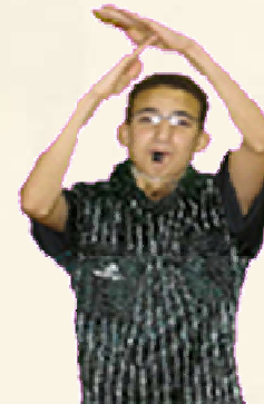
Arrêt du temps