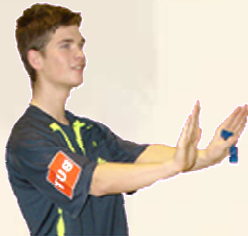
Respect des 3 mètres